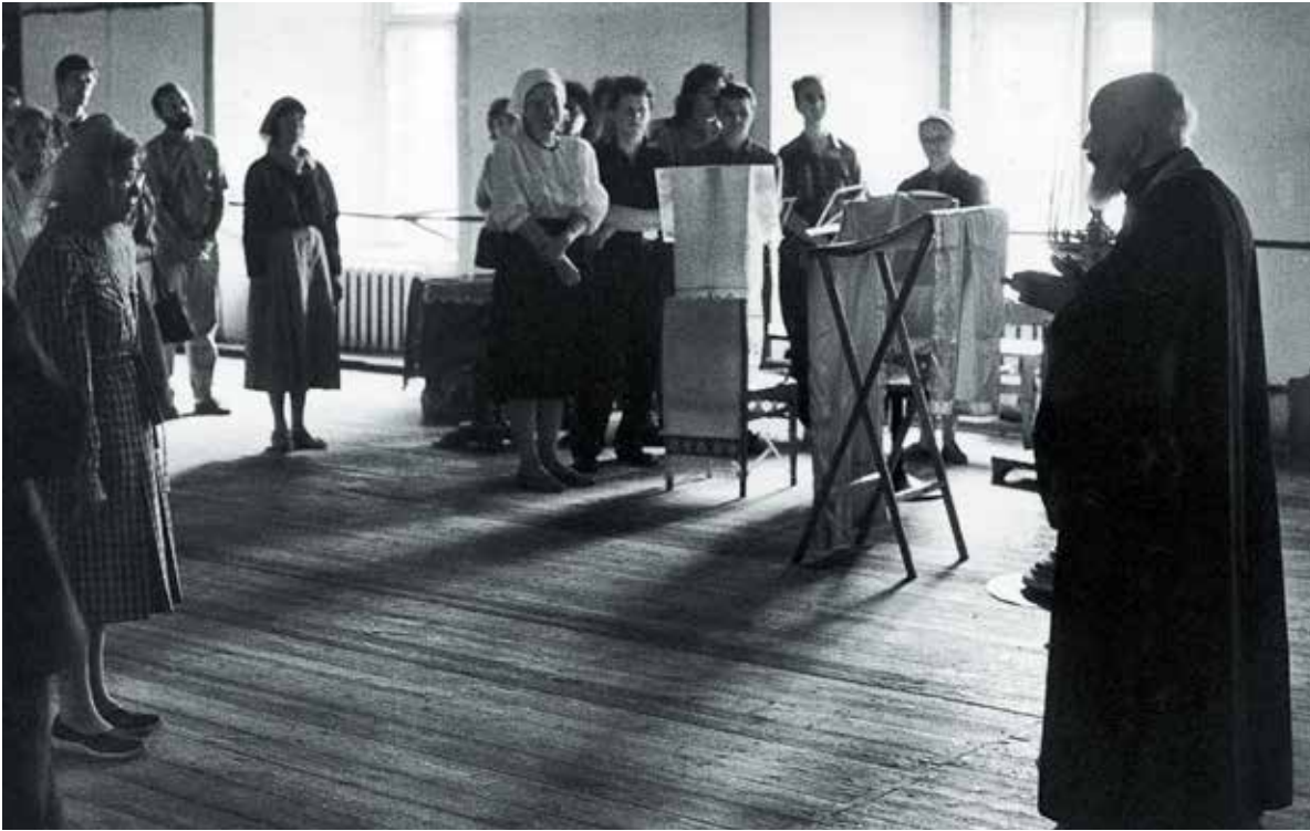
В храме преподобного Сергия Радонежского Высоко-Петровского монастыря, 1992 г.