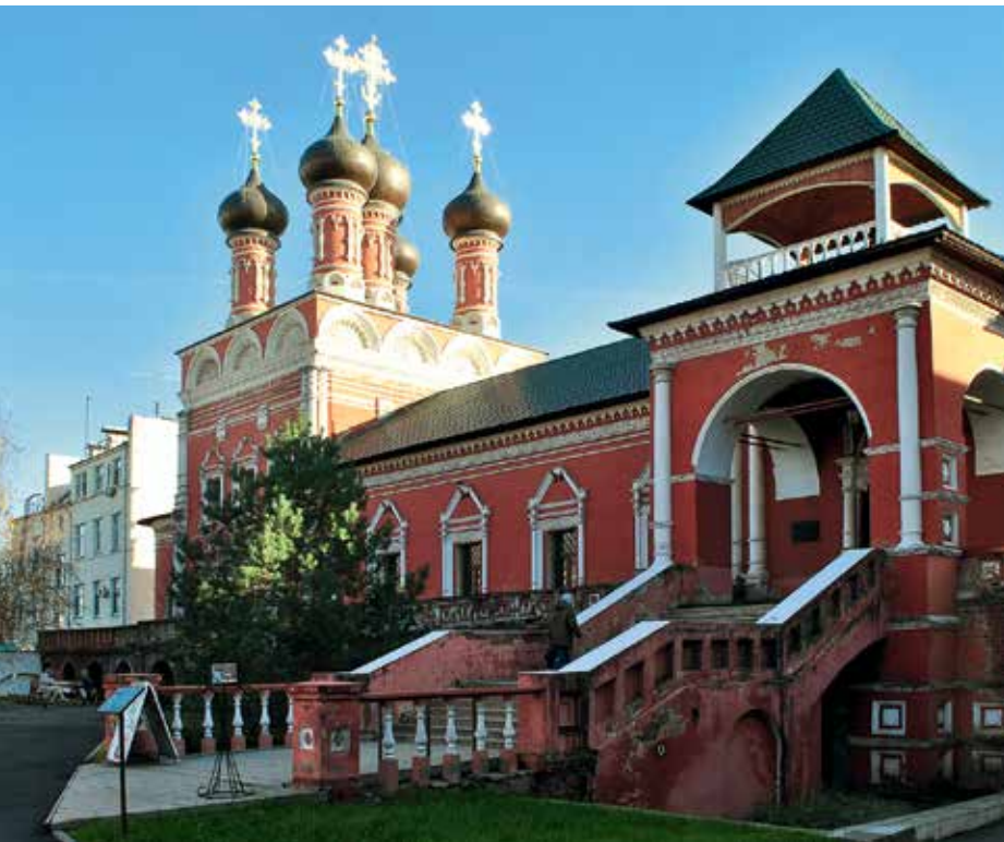
Храм преподобного Сергия Радонежского в Высоко- Петровском монастыре

это в системную работу. Он познакомился с начальником Бутырки, договорился о регулярных богослужениях, поставил перед священноначалием задачу постоянного окормления осужденных, начал диалог с представителями Федеральной службы исполнения наказаний, чтобы Церкви разрешили заниматься просветительской работой в их учреждениях на регулярной основе. Есть что-то глубоко символичное в том, что он восстановил храм в той тюрьме, где вместе с другими новомучениками в годы репрессий сидел и его первый духовник священномученик Владимир Амбарцумов.