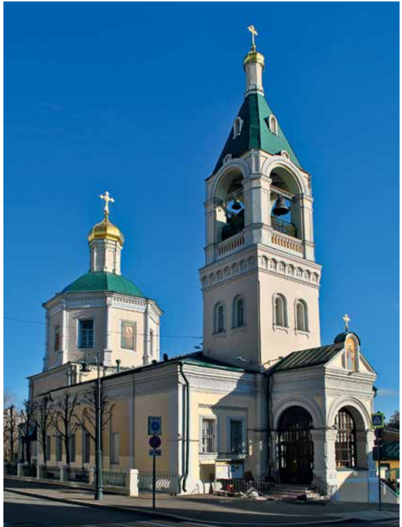
Храм Илии Пророка в Обыденском переулке